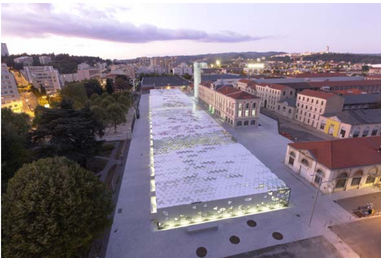
La Platine © LIN Finn Geipel + Giulia Andi

En amont, la Cité du Design organisera un atelier de sensibilisation au design à Saint-Etienne. Conduite en juillet 2015, cette action aura pour objectif de promouvoir l'offre de la Cité du Design et de permettre aux prescripteurs présents de faire la promotion de la convention d'affaire grâce à une connaissance plus fine des enjeux du design et des possibilités d'accompagnement adaptées à chaque type d'entreprise.